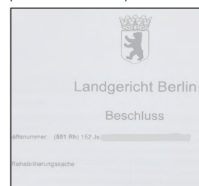
Strafrechtlicher Rehabilitierungsbeschluss des Landgerichts Berlin