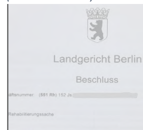
Strafrechtlicher Rehabilitierungsbeschluss des Landgerichts Berlin